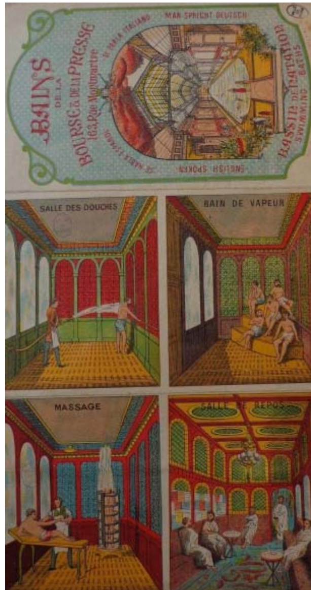
Documento 1 - Pubblicità dei Bains de la Bourse et de la Presse