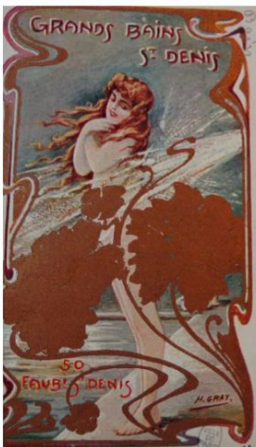
Grands Bains St-Denis 50 rue du faubourg Saint-Denis Prospectus (1905)

In effetti, mentre le maisons de bain , negli anni Sessanta e Settanta del 1800, mettono maggiormente in scena, sulla scia dei Bains d'Angoulême , la varietà delle cure d'idroterapia che forniscono attraverso una giustapposizione di vignette in cui si distinguono le sagome di numerosi bagnanti, sembrano innanzitutto privilegiare, nel primo decennio del 1900, un emblema femminile unico, che occupa l'intera affiche . Le pubblicità dei Grands Bains St-Denis del 1905 e del 1906 sono esemplari, poiché propongono l'immagine molto suggestiva di una giovane donna bionda che indulge voluttuosamente nei piaceri della doccia.