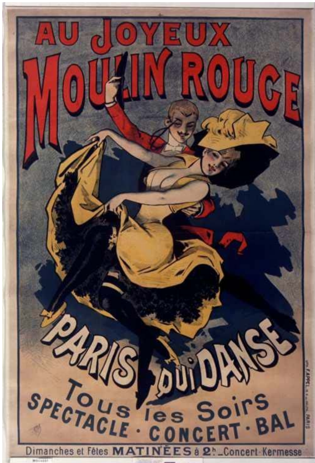
Documento 6 - Affiche del Moulin Rouge (1900)