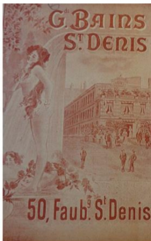
Grands Bains St-Denis 50 rue du faubourg Saint-Denis Prospectus (1906) BHVP, « Actualités », BM7-40