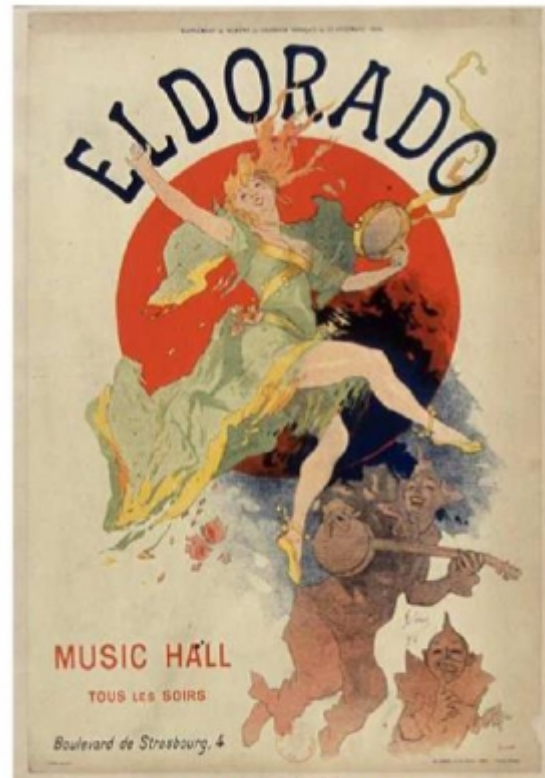
Jules Chéret (1894) - Affiche Gallica ( http://gallica.bnf.fr/ark:/12148/btv1b9003499r )