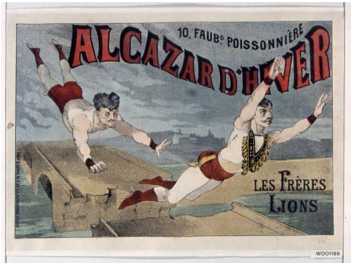
Documento 4 - Affiche de L'Alcazar (1875)