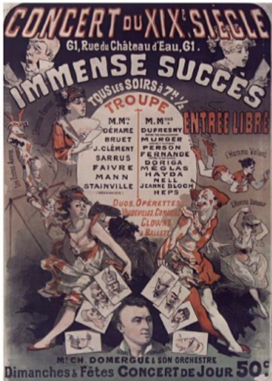
Jules Chéret (1876) - Affiche Gallica ( http://gallica.bnf.fr/ark:/12148/btv1b90154950 )

L'evoluzione dello stile di Jules Chéret (Bargiel Le Men 2010), maestro dell'affiche di café-concert per oltre trent'anni, lascia apparire un processo comparabile: mentre le affiche degli anni Sessanta e Settanta del 1800 «brulicano di personaggi [clown, ballerine, mangiatori di spade, domatori di belve] che eseguono performance reali, le sue affiche successive semplificano le silhouettes e descrivono spesso delle figure immaginate», prima di un cambiamento radicale di stile intorno al 1890. Il café-concert è allora incarnato agli occhi dei parigini dalla chétette , giovane donna gioiosa presentata nel tratto di ballare in abiti corti o fluttuanti nell'aria. In entrambi i casi questi motivi iconografici sono una trasposizione grafica degli elementi topici rilevati in precedenza che punteggiano le figurazioni narrative dei bain e dei café-concerts .