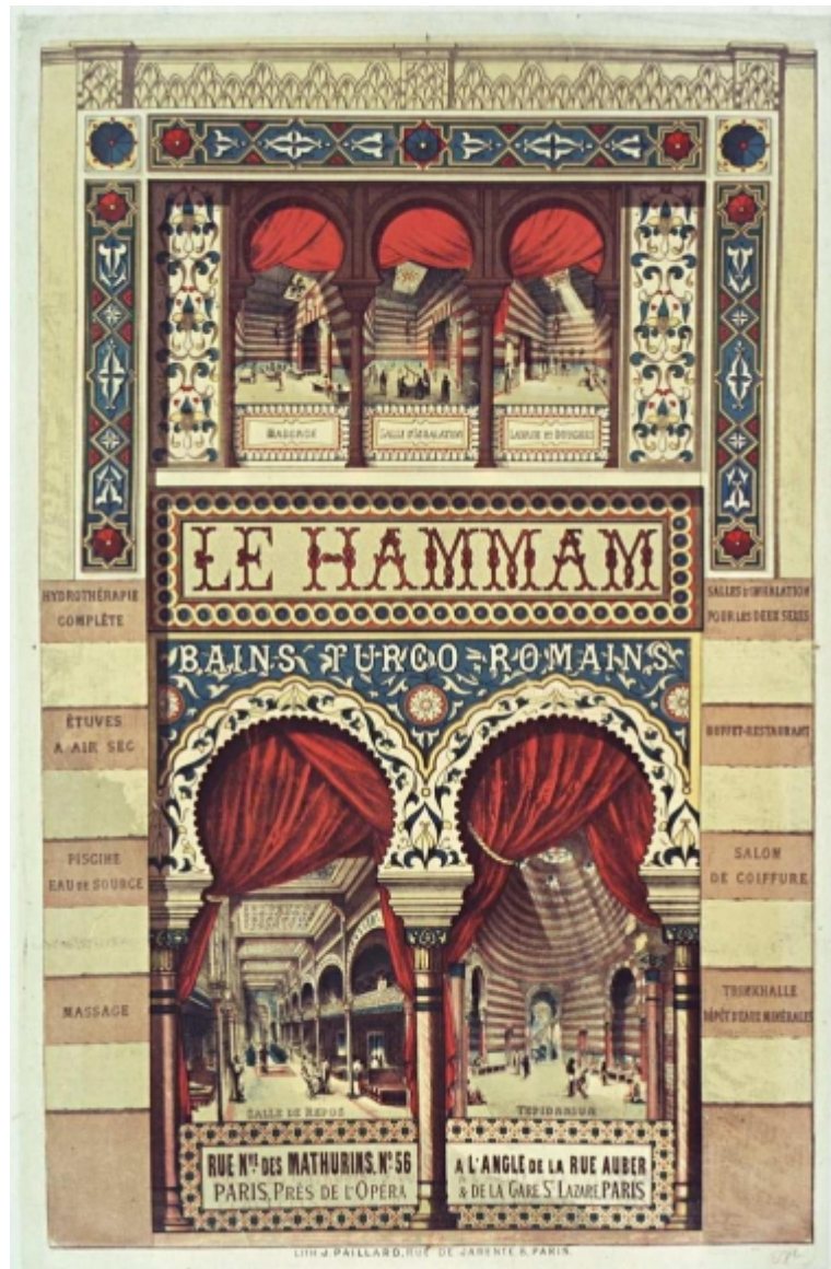
Documento 2 - Affiche dell'Hamam (1876)